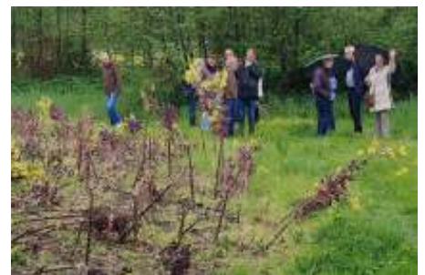
foto: een veld met flowerspruit, een kruising tussen boerenkool en spruitjes!