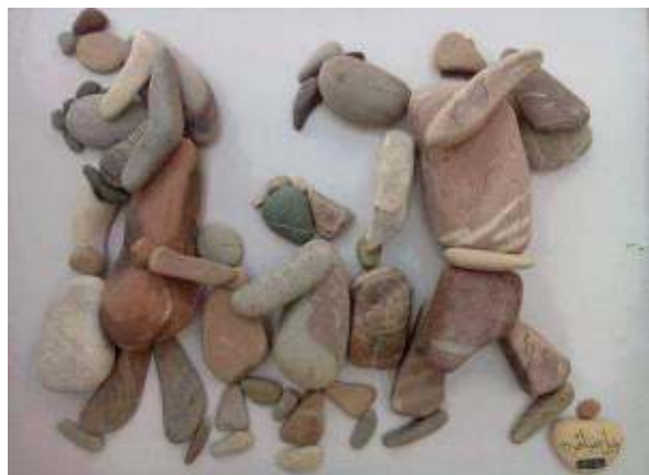
kieselsteen-verhalen Nizar Ali Badr

Alsjeblieft, doe iets tegen de koude wind. Speel niet mooi weer, maar geef échte warmte. Laat je tot tranen toe ontroeren door hun verhalen. Wees medemens.